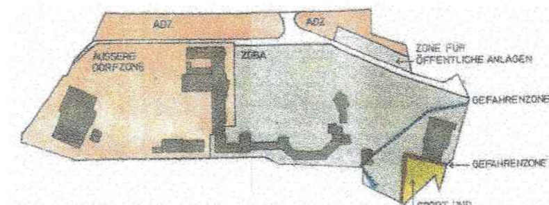
AUSSCHNITT AUS ZONENPLAN VON 1999